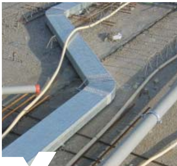
Instortkanalen tbv WTW installatie