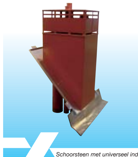
Schoorsteen met universeel indekstuk