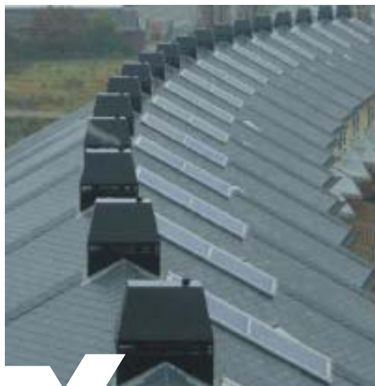
Projectmatige speciale schoorsteen