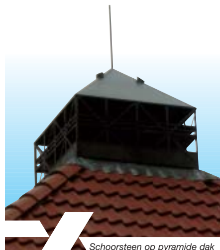
Schoorsteen op pyramide dak