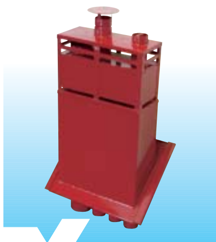
Schoorsteen met panstuk