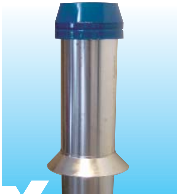
Het Cascade-systeem, elke vorm en elke afmeting

Bij het “Cascade-systeem”, koppelt Breman IJsselmuiden afvoer, uitvoering en dimensionering. Breman IJsselmuiden heeft in samenwerking met een aantal ketelfabrikanten een “Cascade-systeem” ontwikkeld. Een “Cascade-systeem” is een afvoersysteem dat het afvoermateriaal, uitvoeringsvorm en de daarbijbehorende dimensionering naadloos aan elkaar koppelt. De voor het “Cascade-systeem” benodigde afvoermaterialen worden onder Gastec QA keur 96/007-02 geproduceerd. Het systeem is specifiek gemaakt voor situaties waarbij voor blokverwarming meerdere CV-toestellen in cascade worden opgesteld. Breman IJsselmuiden kan deze afvoersystemen in elke gewenste vorm en afmeting uitvoeren en desgewenst monteren.