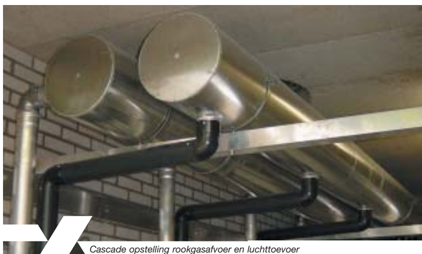
Cascade opstelling rookgasafvoer en luchttoevoer